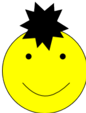
Abbildung 2: Eine Bitmapgrafik eingefügt aus einer PNG-Datei